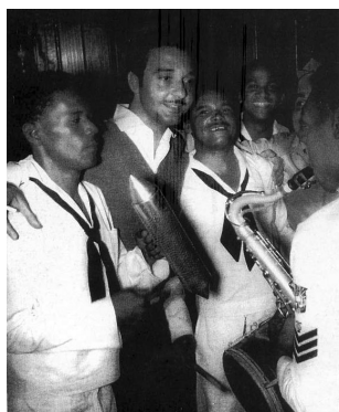
Ramfis Trujillo en una escena de sus comunes francachelas.

Todos reían mientras yo, con toda la calma, le explicaba una cosa que él sabía mejor que nadie. Me contestó: