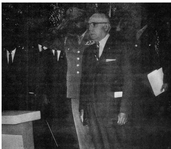
El Jefe presencia el último desfile en su honor. Mayo de 1961.