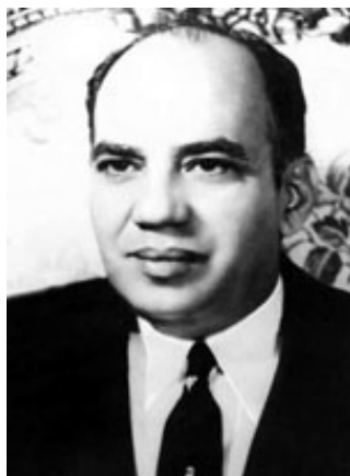
Héctor B. Trujillo Molina (Negro).

Del segundo dictador, Negro Trujillo, Ramfis decía que “era todo un presidente”, oficinas en Palacio, un estado mayor y la conciencia perfecta de la constitucionalidad. Negro se consideró el verdadero Presidente de la República y trataba a Balaguer en la forma y con los tonos con que Trujillo lo había tratado. Incluso antes Ramfis se consideraba el