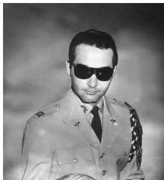
Rafael Leonidas Trujillo Martínez (Ramfis).

Es innegable que Ud. ha sido el más ardiente partidario de la glorificación de los heroicos tiranicidas del 30 de mayo y por eso deseo cooperar con usted en todo cuanto esté a mi alcance para lograr la extradición de Ramfis Trujillo, proceso del cual usted ha sido el pionero indiscutible. Son muchos los obstáculos con que trope-