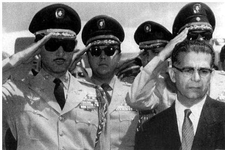
Ramfis Trujillo y Balaguer en compañía de altos oficiales en sus últimos días en Santo Domingo.

No cabe duda, licenciado, de que “A” y “B” fueron testigos de ese crimen horrendo, aunque no tomaran parte en él.