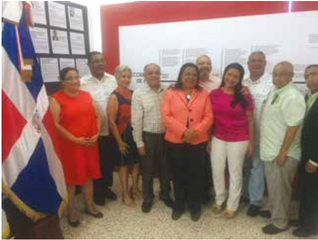
Parte del personal directivo del Museo Memorial de la Resistencia Dominicana y de la UASD, Recinto San Francisco de Macorís, en la inauguración de la exposición “La Prensa de los 12 años”.