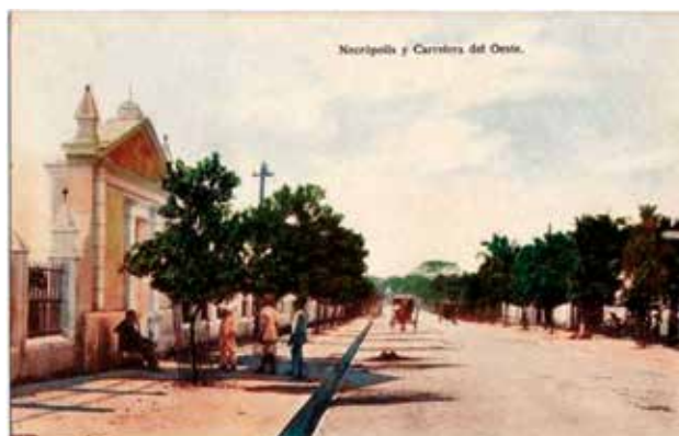
Durante el siglo XIX, vista de la entrada del campo santo que posteriormente pasó a ser llamado Cementerio de la Avenida Independencia.