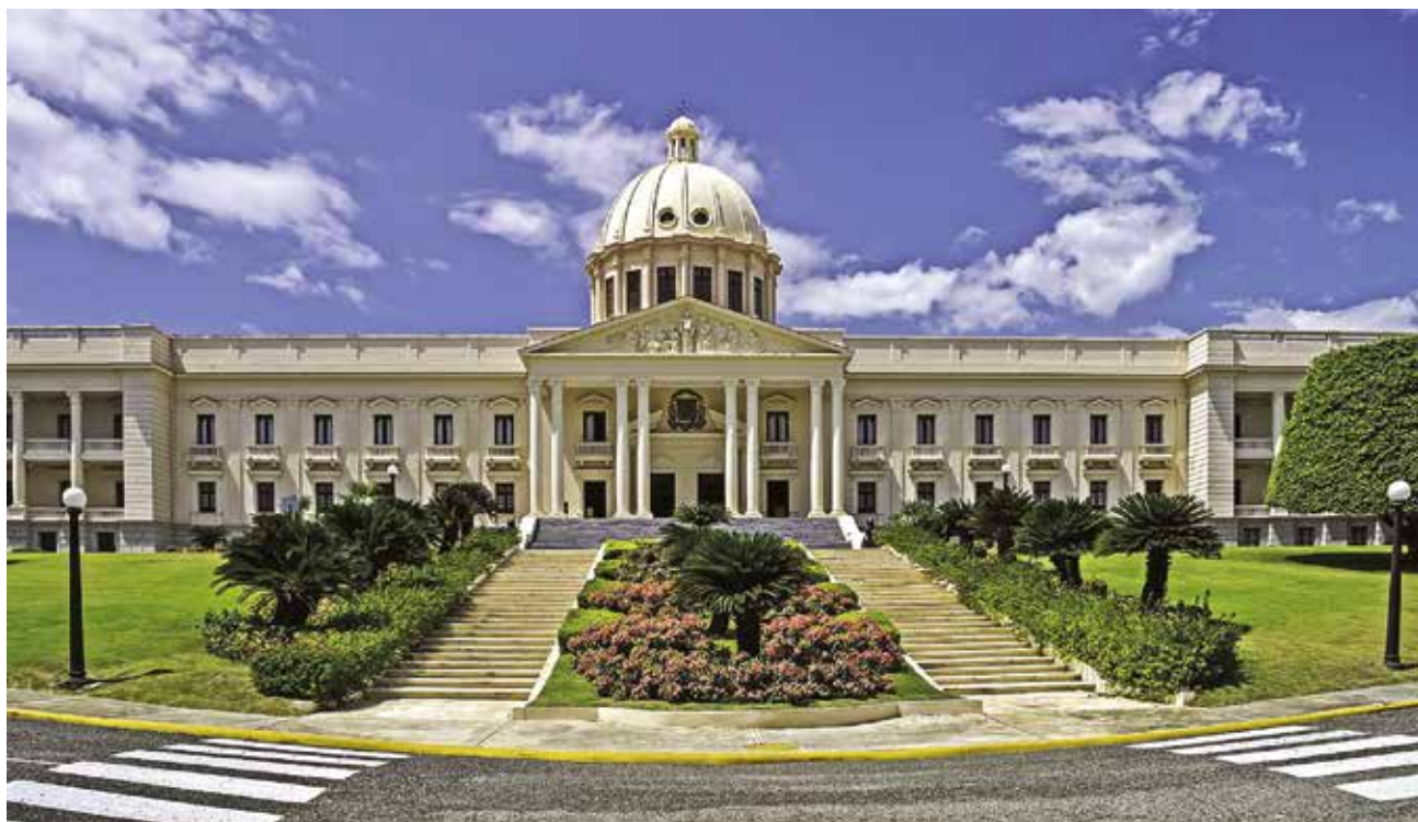
El Palacio Nacional en tiempos más recientes.

establecimientos españoles y de la lucha de éstos contra los indígenas. En efecto, mi vista abarcaba en primer término una magnífica piscina rodeada de cocoteros, dentro de cuyas límpidas aguas buscaban alivio al calor sofocante de agosto algunos cuerpos morenos con evidentes rasgos africanos mezclados a otros muy blancos o bronceados por los aceites de Elizabeth Arden, de turistas norteamericanos. A continuación se extendía un hermoso parque en el que se confundían los árboles de mangos con los de guayaba, guanábana y plátanos. Al fondo, una doble hilera de palmeras bordeando la avenida costanera. Cerraba el horizonte el dilatado y azul Mar Caribe, surcado por veleros pescadores mientras en el cielo, de un azul aún más intenso, flotaban nubarrones blancos como inmensos copos de algodón. Y, como para completar esta visión tropical, un mozo del Hotel, hecho de azabache, de ébano y de chocolate a la vez, penetró en mi habitación para ofrecerme en nombre del Director una jugosa piña en calidad de refresco.