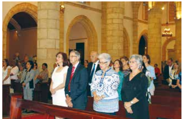
Parte de los amigos y allegados al Museo de la Resistencia que asistieron a la eucaristía por séptimo aniversario de la institución.

Los actos conmemorativos del aniversario también incluyeron la entrega de los premios del “Primer concurso estudiantil sobre la libertad”.