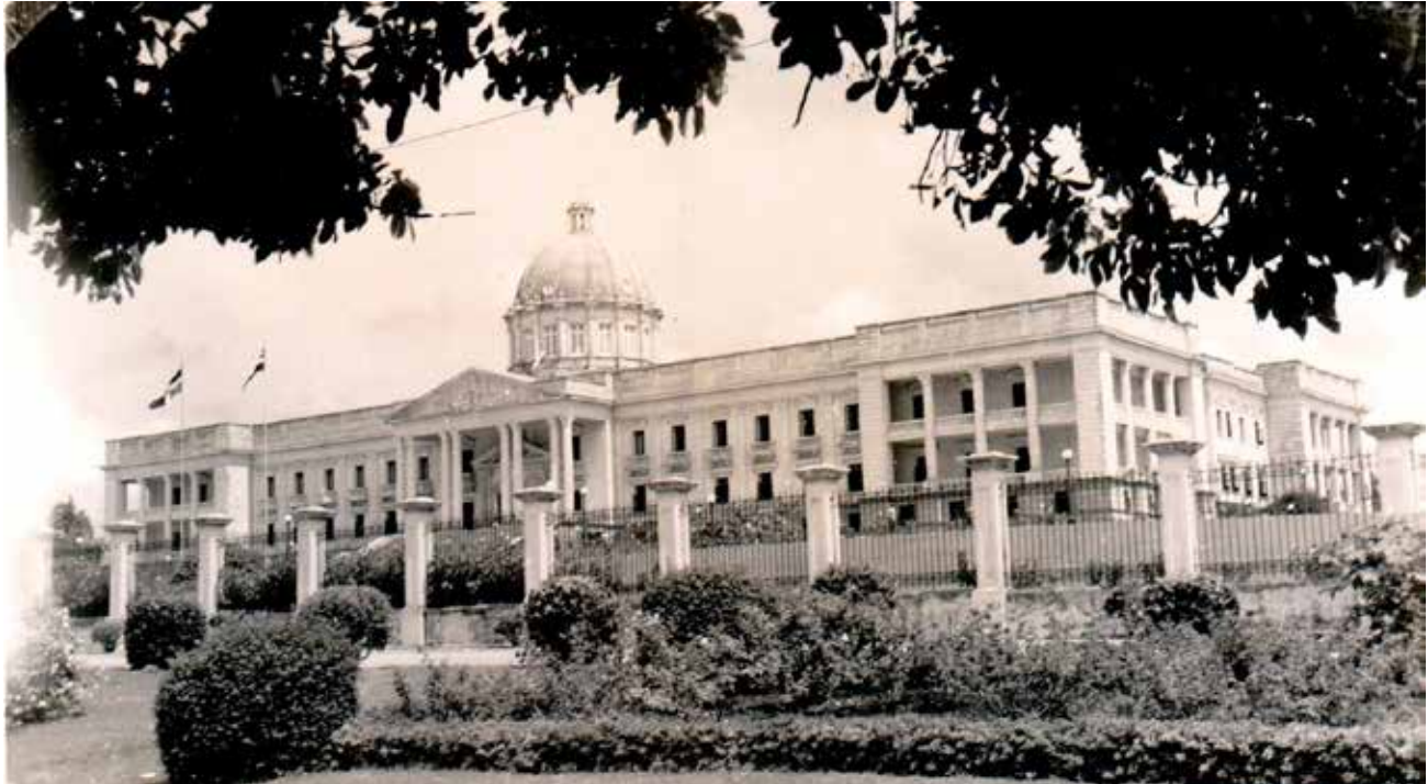
El Palacio Nacional inaugurado en 1947 con motivo de la toma de posesión del cuarto periodo presidencial del dictador Rafael Leonidas Trujillo.

y especialista principal, respectivamente, del Archivo Central del MINREX, por enviarnos una copia, vía internet, autorizando la divulgación del documento. Con ellas compartimos la satisfacción de publicarlo en la revista Memoria , órgano informativo del Museo Memorial de la Resistencia Dominicana, para ponerlo a disposición de los estudiosos interesados en conocer los sucesos acaecidos en ese tramo de la historia dominicana contemporánea.