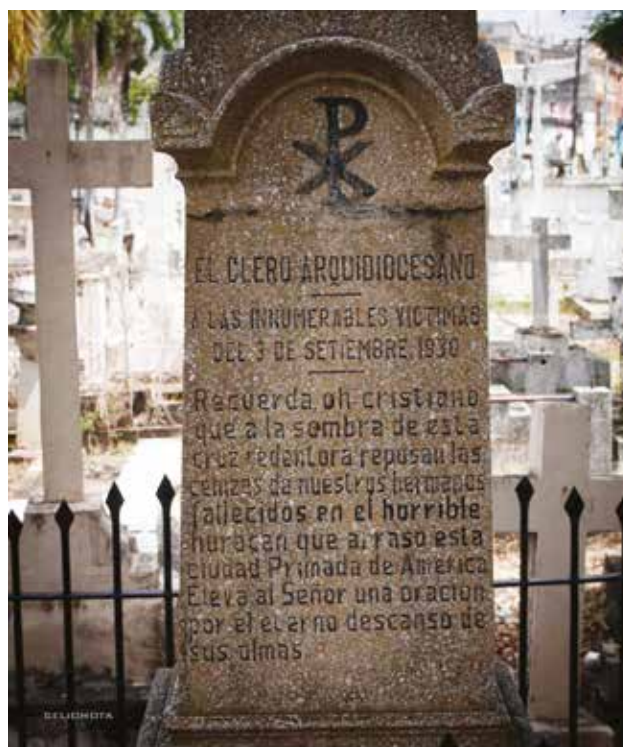
Monumento recordatorio erigido sobre la fosa común donde fueron enterradas las víctimas del ciclón San Zenón que azotó el país en el 1930.