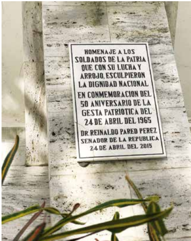
Monumento erigido en la fosa común donde fueron enterrados los combatientes anónimos de la Guerra de Abril de 1965. Fue construida con motivo de los cincuenta años de la contienda.