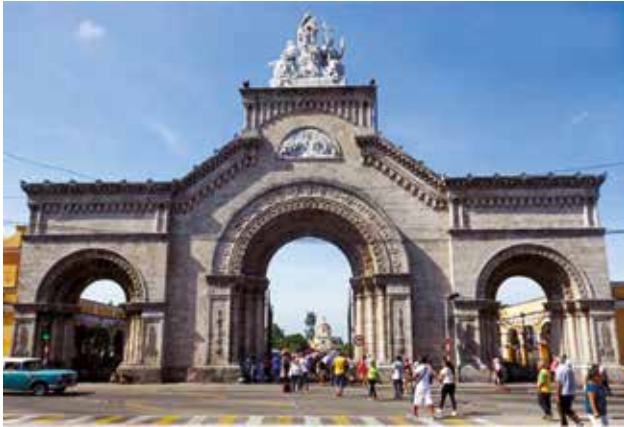
Cementerio de La Habana, denominado "Cementerio o Necrópolis de Cristóbal Colón", La Habana, Cuba.

ocurrido en el país, desde su fundación en 1824 hasta su cierre en 1943, su reapertura momentánea de 1965 y su cierre definitivo en 1966 con el entierro de Amelia Ricart Calventi.