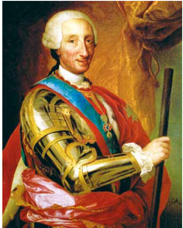
El Rey Carlos III de España (Monarca entre 1759 y 1788). Inició el proceso de modernización de los entierros y de la construcción de los cementerios en todo el reino y dominios de ultramar.

La Real Cédula surgió tras un amplio proceso de consultas e 'investigaciones', a través de las cuales se pudo contar con los suficientes 'argumentos ilustrados' para soportar una medida que visiblemente era antipopular y que