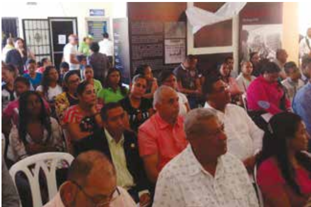
Una panorámica del público que asistió a la inauguración de la exposición “La Prensa de los 12 años”, en la UASD, Recinto San Francisco de Macorís.

Francisco de Macorís, que ha enfrentado las dictaduras que ha tenido la nación a lo largo de su historia”, dijo.