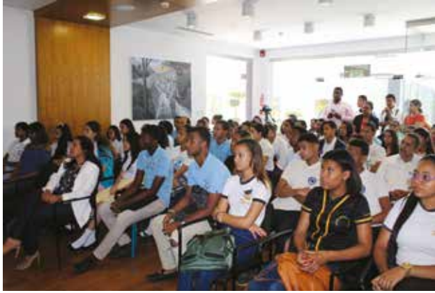
Panorámica de la nutrida delegación de estudiantes de distintos centros de estudio que asistieron al acto de premiación.

Entiende que varios de los concursos que realiza la institución son dedicados a los estudiantes debido a que ellos constituyen el relevo generacional y sobre sus hombros recaerá el crecimiento y la defensa de la democracia y la libertad del país.