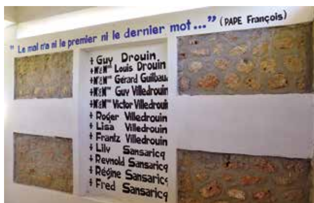
Panorámica de un monumento erigido en Haití para rescatar la memoria de las víctimas de la dictadura de los Duvalier.

En este contexto de discusión sobre los mecanismos deseables para la superación de los traumas colectivos a través de mecanismo de justicia transicional que incluyen políticas de la memoria se sigue manteniendo la polémica entre la asociación del “deber de memoria” con el “deber de justicia”. La demanda de verdad y