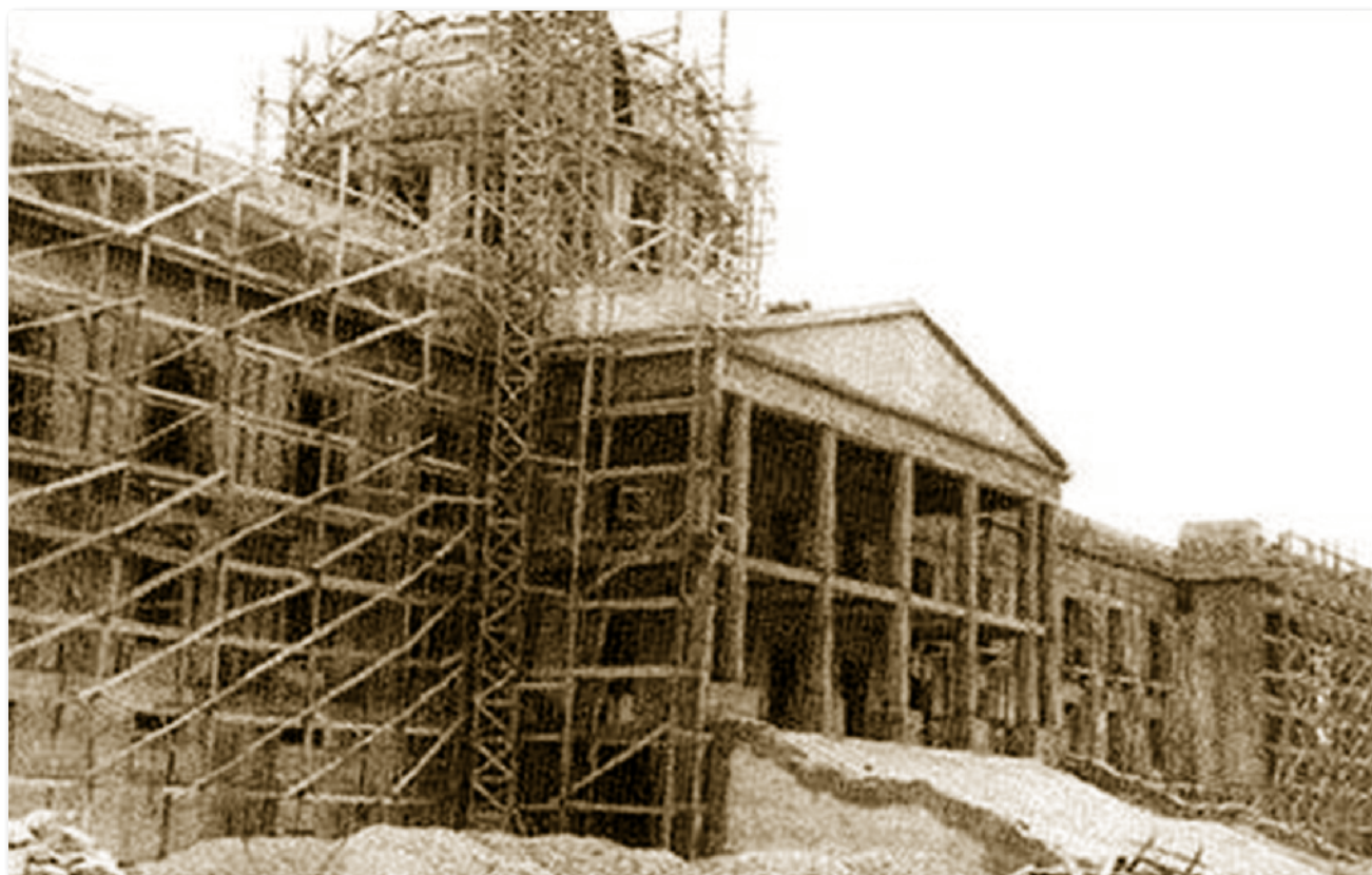
El Palacio Nacional durante su construcción.

implantadas en los dos países que comparten la isla Española, con las siguientes palabras: