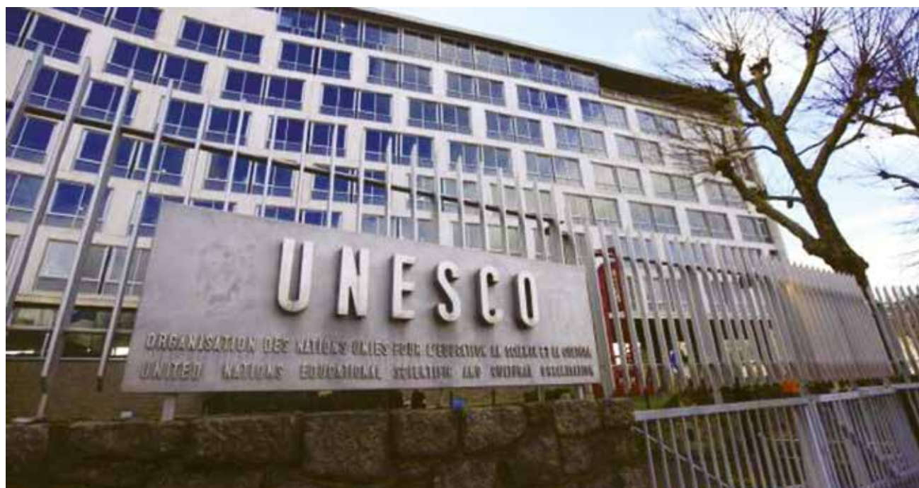
Sede de la Organización de las Naciones Unidas para la Educación, la Ciencia y la Cultura (UNESCO), en París.

lo que hace que la sociedad se mantenga con una venda atada en los ojos y no pueda poner un alto oportunamente a este tipo de violencia.