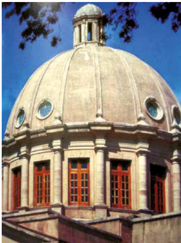
Cúpula del Palacio Nacional vista desde el exterior.

solo al fondo del Salón, en una especie de trono dorado, terriblemente rococó. A ambos lados del Salón y en sillones también dorados, aparecían los Ministros de su Gabinete y otros altos funcionarios del Estado con caras en que se reflejaba, a la vez, el temor y la adulación.