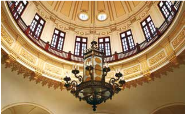
Cúpula del Palacio Nacional vista desde el interior.