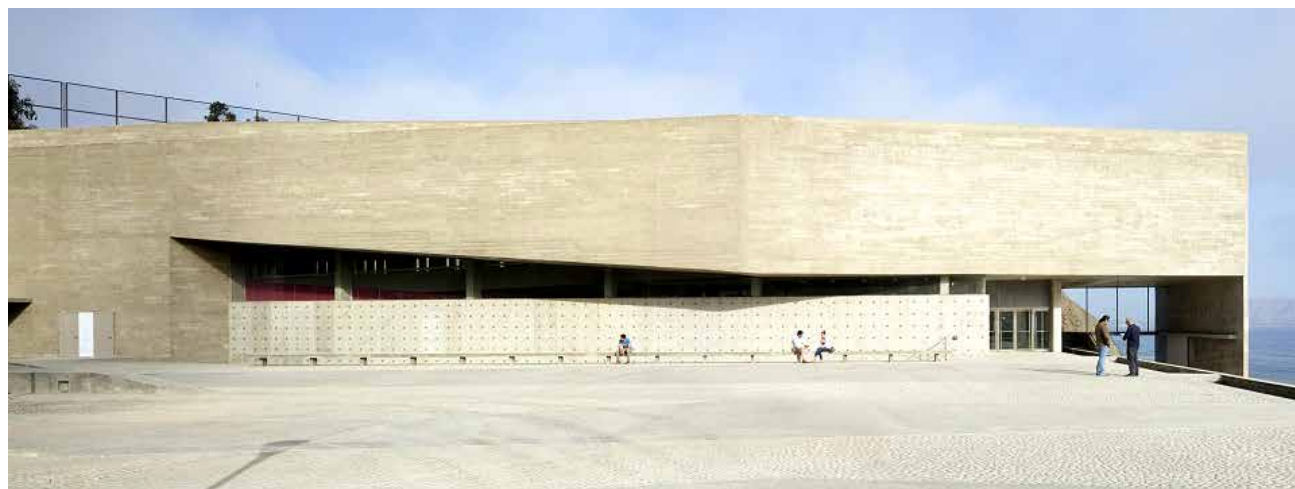
El Lugar de la Memoria, la Tolerancia y la Inclusión Social (LUM), creado por el Ministerio de Cultura de Perú, se enfoca en torno a temas de derechos humanos ocurridos durante el periodo 1980-2000 en ese país.

un valor que debiera guiar el contenido de la legislación 36 . En todo caso, muchos países han preferido separar las tareas de la justicia política y la representación histórica, salvo los alemanes desde 1989, con resultados altamente problemáticos. Es imposible saber si la verdad y la justicia han sido factores críticos que han ayudado a la consolidación de una democracia. Alcanzar una verdad y una justicia absolutos resulta una tarea imposible, ya que es muy raro una total inversión simbólica, política y moral entre los represores y sus víctimas 37 . Al menos esto nunca se ha logrado por medios democráticos.