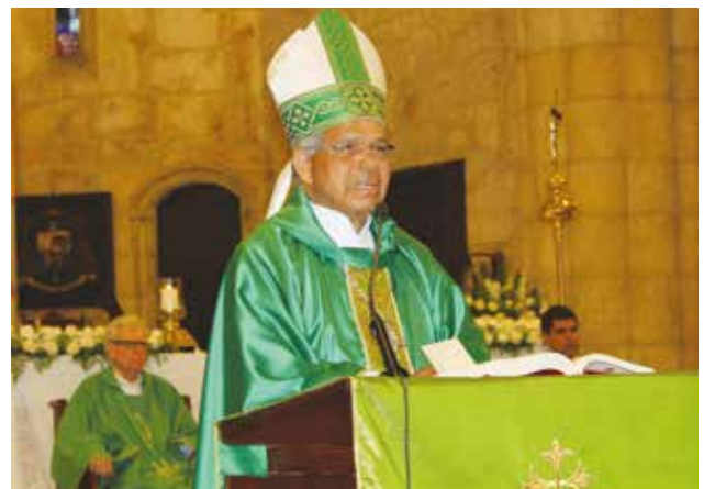
Monseñor Francisco Ozoria Acosta, Arzobispo Metropolitano de Santo Domingo, mientras ofrecía la misa por el séptimo aniversario del Museo Memorial de la Resistencia Dominicana.

Monseñor Ozoria destacó el rol que desempeña el MMRD en la sociedad dominicana actual e instó a que más ciudadanos se sumen a esta causa. Resaltó que es importante apoyar una institución que pretende mantener en la memoria del pueblo los acontecimientos vividos durante la tiranía y que la gente sepa que no se deben olvidar para evitar que se repitan.