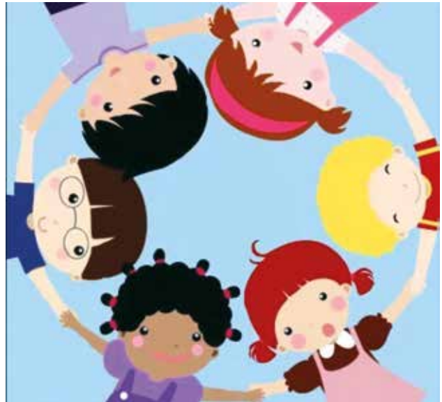
La meta debe ser “comportarse fraternalmente los unos con los otros”.

Tanto personas de la vida cotidiana como famosas, que han sufrido acoso escolar, se han hecho eco de la problemática mostrando las consecuencias, pero sobre todo implementando acciones para abordar la práctica de intimidación; en unos casos mediante el sometimiento a los acosadores, y en otros ayudando emocionalmente a las víctimas de abuso. Un ejemplo de estas acciones es la cantante y compositora Demetria Lovato, mejor conocida como Demi Lovato. Ella, en diferentes entrevistas, da a conocer lo que sufrió mientras estaba en la escuela; hoy en día es una de las estrellas juveniles más famosas y trabaja junto a la ONU para disminuir el acoso escolar.